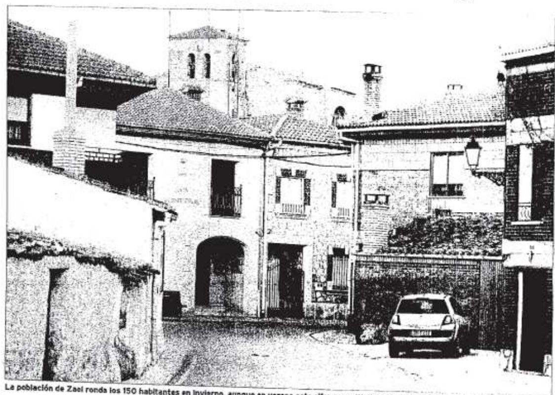
La población de Zael ronda los 150 habitantes en invierno, aunque en verano esta cifra se multiplica asombrosamente.

¿Cómo se ha llegado a este caso? Algunos de los afectados se han visto obligados a recibir tratamiento en Madrid han podido contactar con la Fundación de Hipercolesterolemia Familiar, una entidad creada en 1997 e integrada por afec-