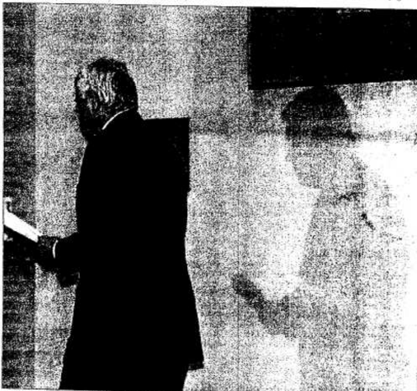
Maragall lee un comunicado en respuesta a los últimos acontecimientos políticos, ayer en el Palau de la Generalitat.

Maragall dejó ayer muy claro que no habrá disculpa y no dudó en manifestar su disgusto por la forma de actuar de CiU. Sigue en página 8 Editorial en página 3